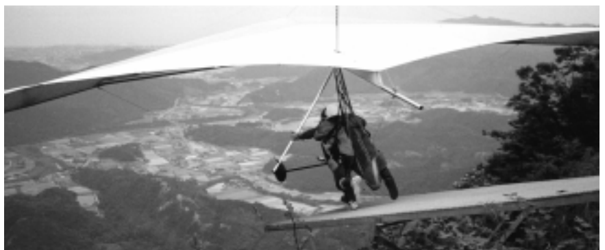
白鳥エリアは抜群のフライト確率を誇る。ビジター大歓迎!