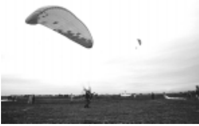
1日だけの競技だったが十二分に楽しんだ。

今回のJHF補助動力付パラグライディング日本選手権に参加した感想の前に、私の自己紹介をします。